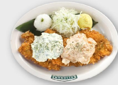
스파이시 돈카츄 Spicy Ton-Katsu