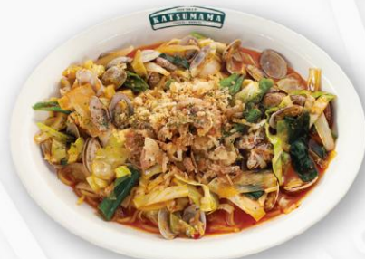
스파이시봉골레 Spicy Vongole