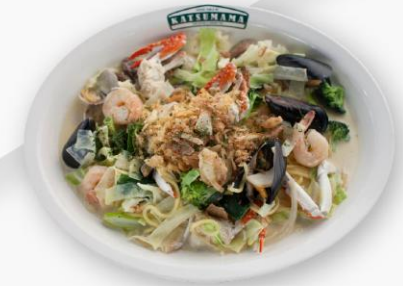
해산물크림파스타 Seafood Cream Pasta