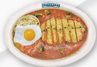
카우돈 Curry Udon