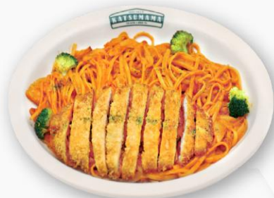
로파돈 Rose Pasta Ton-Katsu