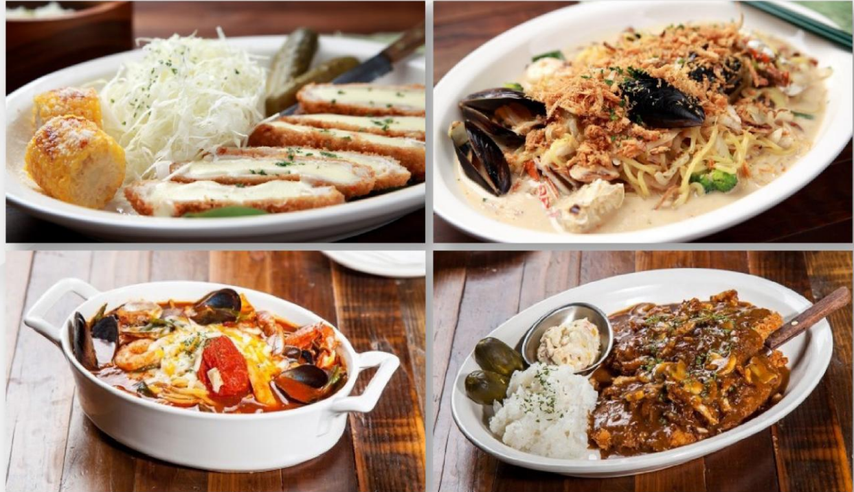
좌측 상단부터 시계방향으로, 통치즈카추 / 해산물파스타 / 클래식돈카추 / 토마토짬뽕

친근하지만 놀라운 한입 돈카추를 중심으로 파스타, 짬뽕, 짜장면까지 전세대 남녀노소 모두에게 사랑받는 메뉴로 구성되어 있습니다.