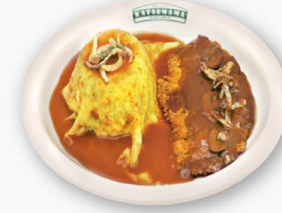
돈무라이스 Omlet rice Ton-Katsu