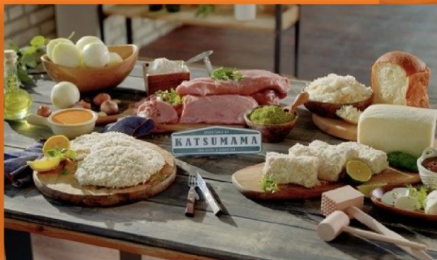
CJ 오쇼핑 최화정 쇼 완판