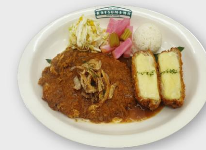
스파이시 돈카츄 Spicy Ton-Katsu