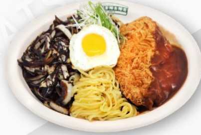
짜장돈카츄 Black Bean Noodle Ton-Katsu