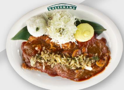
스파이시 돈카츄 Spicy Ton-Katsu