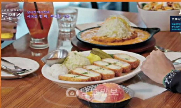
JTBC 더 로맨스