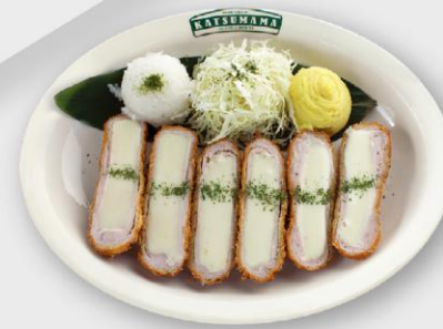
오리지널 돈카츄 Original Ton-Katsu