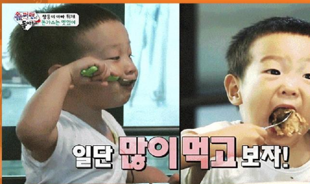
KBS 슈퍼맨이 돌아왔다

네이버부터 인스타그램, 페이스북까지, SNS에서 다양한 고객 리뷰로 증명된 카슈마마!