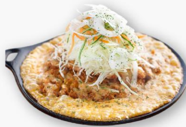
철판치즈누룽지돈카츄 Grilled Cheese Ton-Katsu