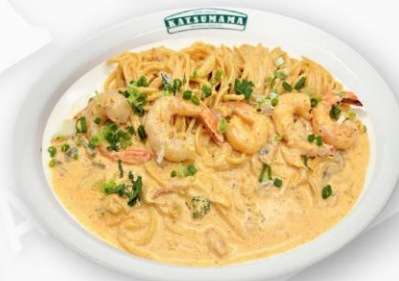
투움바파스타 Toowoomba Pasta