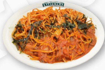
토마토파스타 Tomato Pasta