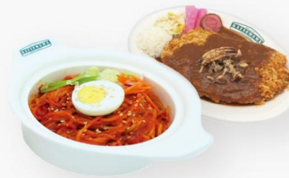
비빔파스타 돈카츄 Chewy Noodle + Ton-Katsu