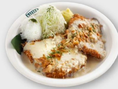
오리지널 돈카츄 Original Ton-Katsu

친근하지만 놀라운 한입 돈카츄를 중심으로 파스타, 짬뽕, 짜장면까지 전세대 남녀노소 모두에게 사랑받는 메뉴로 구성되어 있습니다.