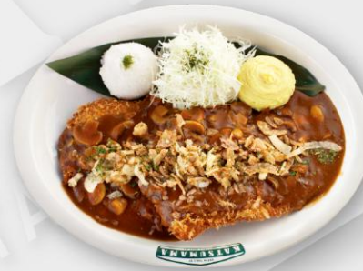
오리지널 돈카츄 Original Ton-Katsu