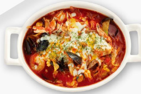
토마토편뽕 Tomato Jjamppong