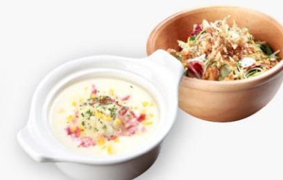
크림스프와 그린마마 샐러드 Cream Soup & Green Salad